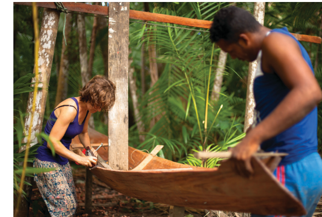
Veronique Isabelle, Uma canoa em Jamaci (A canoe in Jamaci), 2015, sound installation

Transmissão Fordlândia is an activation of an outlet, a collection of samples, an amalgam of audio archives, a transmission, and a stimulation of cultural activity inspired by the long history of embodied sound and