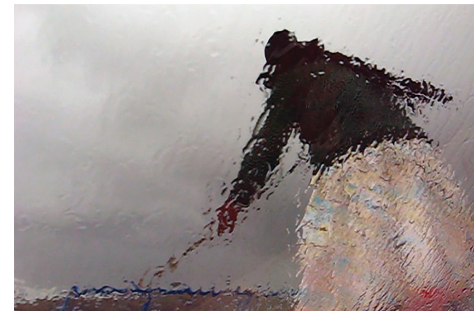
Gabriel Martinho, Desancorar da ilha (Undocking from the island), 2015, Video (still)

as their main medium for active exchange, 2) a live radio broadcast for two days to share this content, and 3) a site-specific sound exhibition that will feature new site-specific works. Transmissão Fordlândia will include performances, stories, and audio experiments, all taking place in the abandoned Ford Factories. Each project considers how the river, roads, the legacy of rubber, and the history of radio influence today's Fordlândia. It will record a moment in time as the echoes of memories persist, consciously and unconsciously, in the lives of the inhabitants, and in their encounter with the infrastructures that enable or disable social connection across the region. It will review how agricultural accelerations, economics, and communication technologies also mean the loss of forest and the Amazon home, and will provide a frontier of resistance to capitalist production and destruction.