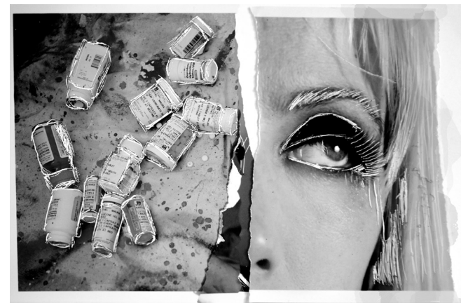
Maura Terese, What is this for? , 2015, Photograph of etching, 8 x 10 in

a career, making it the number one killer of the age group. The exhibition is presented at N-mark, an experimental arts organization that regularly supports young artists. Absences emphasizes the importance of mental health, especially for young adults as they embark on periods of major self-development. The context of the city of Nagoya offers a fertile ground of conversation-stimulating approaches to views and experiences of mental illness and absence.