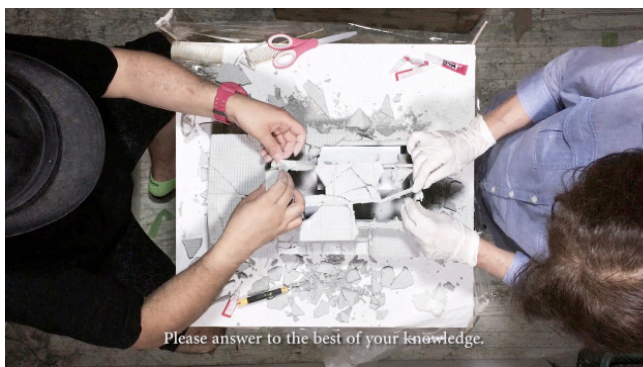
Atsushi Watanabe, My wounds/ Your wounds , 2017, Video, 31:31 min

Nagoya was selected as the location of this exhibition because of its large number of colleges and universities, which account for Nagoya’s large percentage of young adults and college students, the age group that tends to be most affected by mental illness in Japan. Young adults in Japan have the fastest growing suicide rates, largely due to the pressures of school and beginning