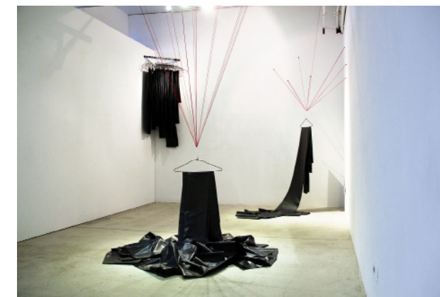
Chen An An, The Unbearable Lightness of Being , 2016, Trash bags, yam, hangers, Dimensions variable

Chen An An is a multimedia artist from Taiwan whose work explores queer sexuality and self-identity within the complexities of social systems. The Unbearable Lightness of Being (2016) is an installation piece that calls attention to and mourns the loss of the many LGBT youth in Taiwan who take their own lives as a consequence of depression stemming from deep social repression. Chen folds trash bags, a ubiquitous but overlooked material, mirroring a common funerary practice in Taiwan where mourners fold the clothing of the departed. Removing these and other belongings from the home underscores this new absence from the family unit and from society at large. The piece invites the visitor to consider the devastating number of suicides caused by social intolerance and alienation of LGBT youth.