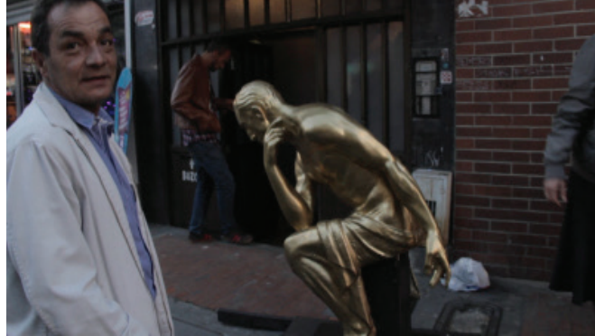
Matilde Guerrero, Por el alma de Leo Kopp , 2024, Sculpture, performance, 170 x 80 x 160 cm

Working in an office building, it seemed logical to examine work itself as a means of communication. The most basic human interactions, after family relationships, are always related to the economy. Matilde