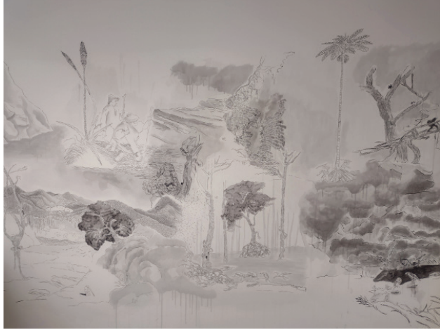
Luisa Roa, Imaginario de un tiempo enmarañado , 2024, Mural painting

espectro invisible que puebla nuestros entornos e interacciones más comunes.