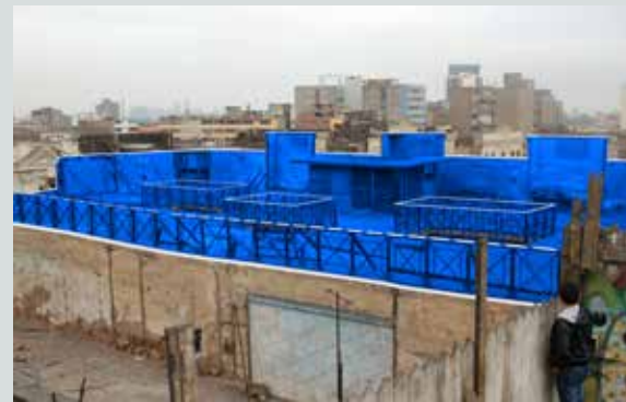
Taller de Artesanía Salvaje (TAS) "Blueprint" proposed project for Lima Rooftop Ecology , 2012

For Lima Rooftop Ecology the participating artists have created site-specific works that give form to different aspects, dimensions, and tensions around the "urban topography" of roofs, façades, and streets that serve as a porous skin between the private and the public.