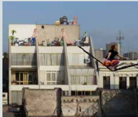
CITIO, 3 Funciones 3" proposed project for Lima Rooftop Ecology, 2012

El proyecto Ecología del Techo de Lima confronta las nociones de paisaje urbano y hábitat, para generar señalamientos e intervenciones específicas, usando los espacios de los techos y las complejidades de sus ecologías diversas como punto de partida. El proyecto tiene la intención de reflexionar sobre el potencial de los techos del centro urbano, para promover otras perspectivas y visiones del paisaje urbano local. Todo esto como un caso de estudio en un barrio con status de patrimonio protegido.