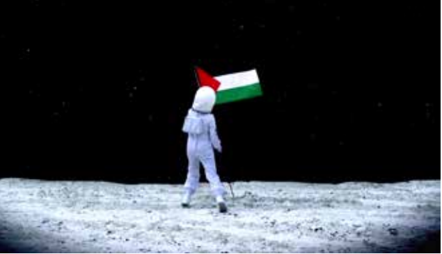
Larissa Sansour, A Space Exodus, 2009, Video (red cam, HD), 5:24 minutes

إلى جانب عمل مرتضى آخر لعلاء ابتكار : «نفق في السماء» يناقش أيضاً الخيال العلمي. ابتكار فنان إيراني يعيش في سان فرانسيسكو، يجمع طباعات جبرية أحاديّة على نسخ من روايات الخيال العلمي لروبرت هيملن من ١٩٥٥، ويعتمّ بذلك على الصفحة الأدبية بالنجوم والسماء. الطبعات الملتوية