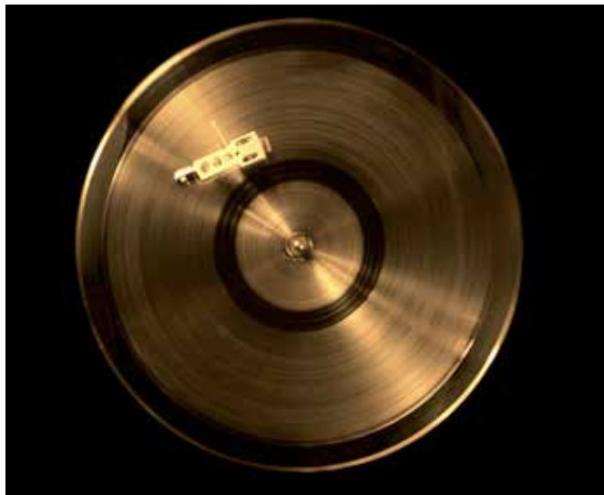
Khalil Joreige and Joana Hadjithomas , The Golden Record (Part III of The Lebanese Rocket Society project) , 2011, Video projection and digital print, 19 minutes

fiction. At the same time, the exhibition reveals the ways in which artists are using such ideas as catalysts for the critical articulation of urgent questions on earth. In their hands, outer space is a vehicle for reflection upon legacies of colonialism, formulations of history, the militarization of space, and the intersection of landscape and politics.