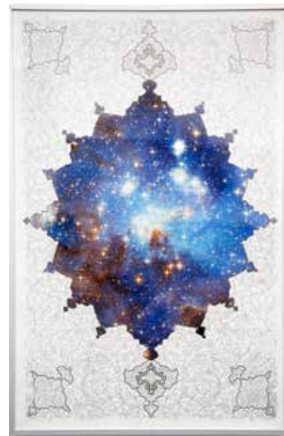
Ala Ebtekar , Journey to the Moon , 2015, Archival Inkjet print on found poster, 41 x 27 inches

Al-Ani's Shadow Sites II photographic stills speak interestingly to A Space Exodus , as al-Ani counters simplistic understandings of Middle Eastern landscape as barren, empty, and lifeless. For Shadow Sites II , al-Ani travelled across Jordanian airspace,