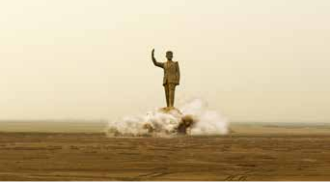
Ali Cherri, Pipe Dreams, 2011, Video installation, 5 minutes

هيكلية المعرض هي نتيجة للسرعات مع البنية التحتية للفن بيروت. ومع عدم وجود الدعم الحكومي للفنون في لبنان، العدد القليل من المتاحف (و غيرهم قيد التطوير)، ومشهد الفن التجاري المتزايد، كان إيجاد مكان غير هادف للربح للمعرض مهمّة صعبة. كان البديل خلق تعاونا ديناميكياً بين أمكنة ذات هويات متنوعة، جميعها غير هادفة للربح، وقد فتح ذلك الباب لإحتمالات مثيرة. وتهدف الأعمال إلى الإيصال بين المساحات / المجموعات / المحفوظات التي تنحدر منها، و إلى دعوة الزوار لقضاء فترة أطول مع عمليّن في محادثة ممكنة في كلّ من الأماكن. منتشراً في أنحاء بيروت «أنامل بين الفضاء» يقدم طرق متعددة من خلال معرض يترافق مع برنامج فعاليات متعددة.